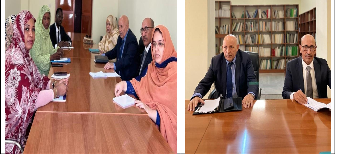
49. 12/03/2024 صورة من مكتبة الأكاديمية الدبلوماسية الموريتانية في ثوبها الجديد حيث العمل جاري لتنظيمها وتجهيزها بغية إتاحة الاستفادة من محتوياته.